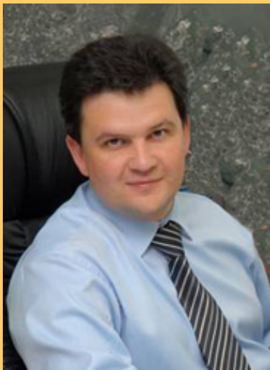
Максим Алексеевич Акимов

вице-губернатор Калужской области, член резерва управленческих кадров, находящихся под патронажем Президента России